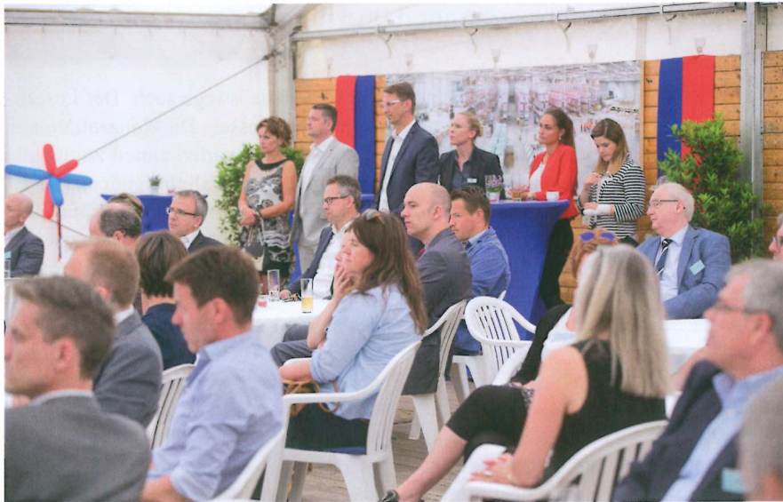
Drei anregende Vorträge über die Perspektiven der Logistik fanden bei den Gästen lebhaftes Interesse

Bei perfektem Wetter begingen zahlreiche Gäste mit Geschäftsführung und leitenden Mitarbeitern der ZTV Logistik das 20-jährige Bestehen des Unternehmens am Hauptsitz in Krefeld.